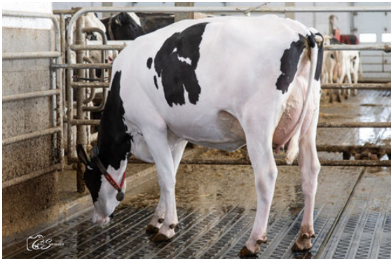
MARICAN MOLIERE LOUISIA DAUGHTER