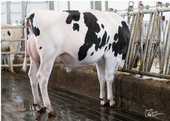
LEOTHE MOLIERE DESSINE DAUGHTER