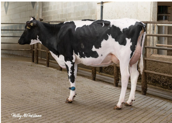
WESTCOAST MLIRE FAR8391 11926 DAUGHTER